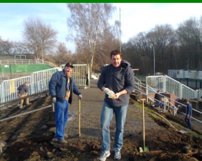
Leutzscher Welle live bei der Arbeit

Ronalds Leistung an diesem Wochenende war einfach nur Klasse!